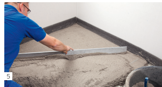
5 Verdichten und abziehen