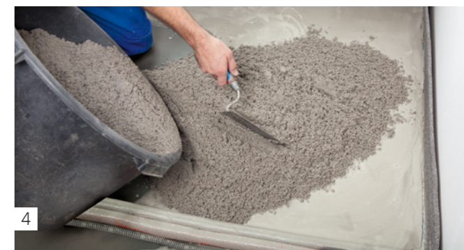
4 Angerührtes BLANKE BASEMAX nass in nass verteilen