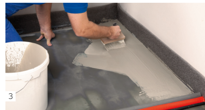
3 Auftragen der angerührten Haftbrücke