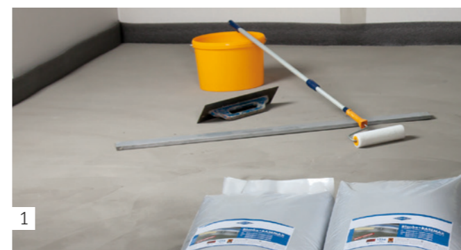
1 Hilfsmittel und Material bereitlegen