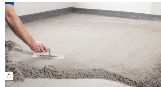
6 Glätten. Verlegereif nach nur 12 Stunden