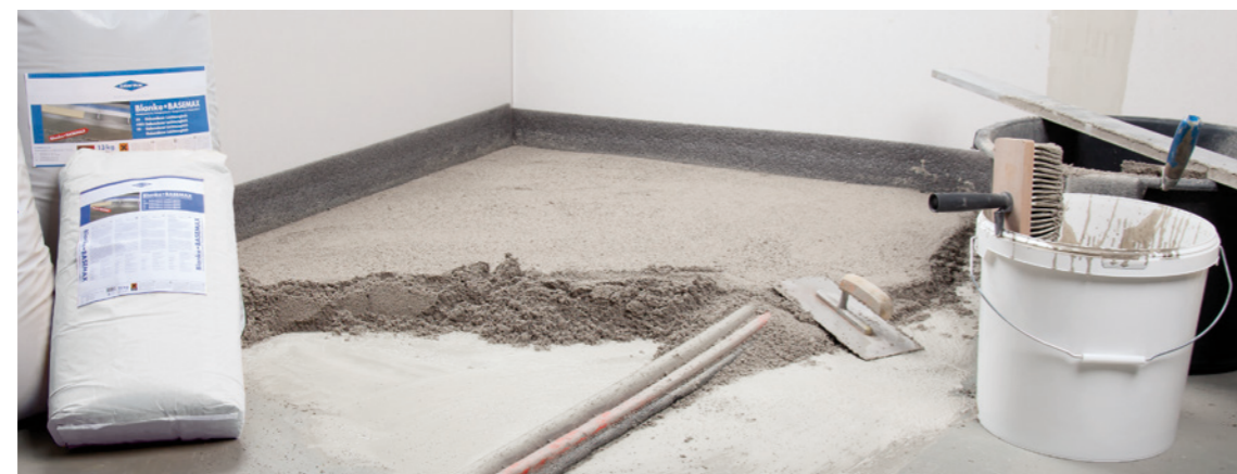
Problemlose Einarbeitung von Rohren und Kabeln

BLANKE BASEMAX besteht aus Leichtfüllstoff in Form von Blähglasgranulat und einem zementären Bindemittel. Mit Wasser gemischt entsteht aus den beiden Komponenten ein gebundener Leichtausgleich mit dem unebene Untergründe – egal ob Beton, Estrich, Spanplatten oder Holzdielen – von nur 5 mm bis sogar 100 mm ausgeglichen werden können. Dabei zeichnet sich BLANKE BASEMAX durch sein äußerst niedriges Flächengewicht aus, das 75% leichter als ein vergleichbarer herkömmlicher Estrich ist. Bereits nach 12 Stunden ist BLANKE BASEMAX verlegereif und die Blanke Bodensysteme können ohne weiteres direkt verklebt und aufgebaut werden.